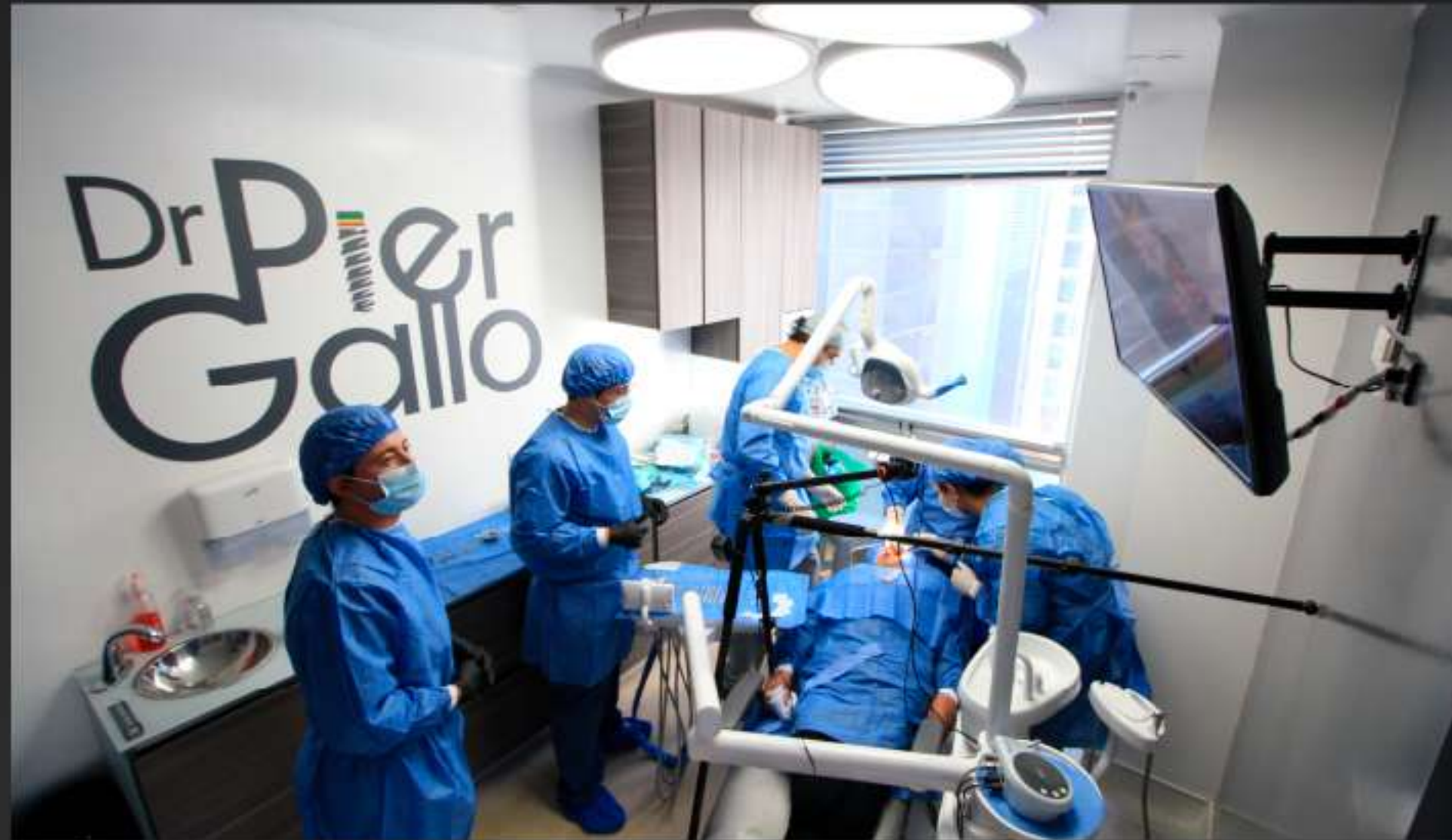
Cirugía con paciente en vivo